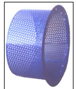
Grillage de recharge

Raffineur pour accomplir manuellement ou automatiquement l'opération simultanée d'aspiration, de raffinage et de transport des copeaux à travers une surface forée cylindrique fixe, des marteaux flottants et tournants interchangeables, un groupe de ventilation qui intéresse le champ de l'écolements des déchets de bois.