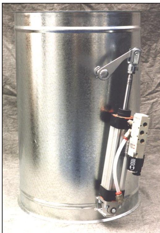
Variante à disque

Pneumatiques: commandés par un cylindre à l'air comprimé